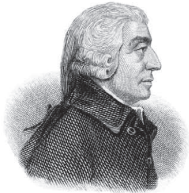
FORSKJELLER. Adam Smith ville bli begeistret over at økonomene igjen diskuterer hvorfor noen land er rike og andre så fattige.