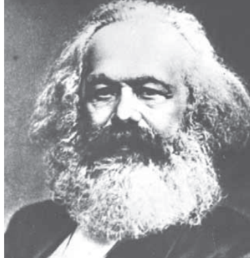
SAMMENHENGER. Karl Marx ville glede seg over at flere økonomer nå tar historie på alvor og ser sammenhengene mellom politikk og økonomi.