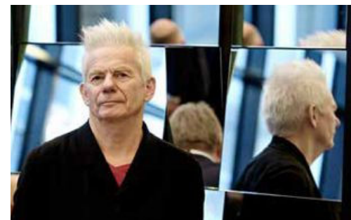
UTJEVNING: – De kollektive lønnsforhandlingene er under press, men det viktigste vi kan bevare for å drive utjevning, sier økonomiprofessor Kalle Moene.

– Men skattesystemet er lite egnet for å få til en bedre utjevning. For å få det til er det bedre å bruke offentlige velferdstilbud, sier professoren.