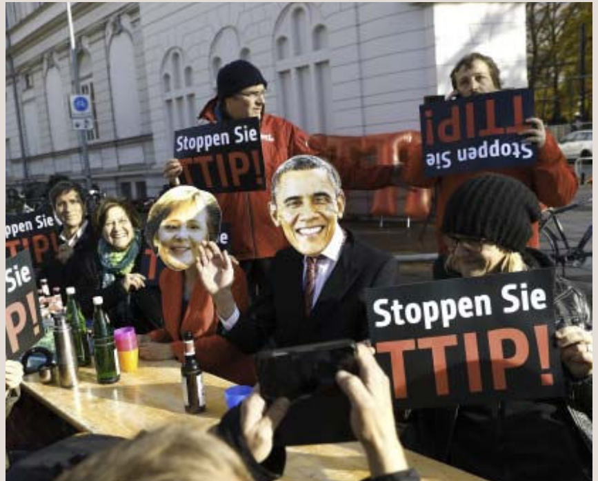
Frihandel og globalisering er blitt syndebooker. For en uke siden gikk folk i Hannover i Tyskland i demonstrasjonstog for å vise sin motstand mot TTIP - den nye frihandelsavtalen mellom EU og USA. Ingen går i demonstrasjonstog for frihandel.

Internasjonal handel tillater verdens land å spesialisere seg og bruke sine ressurser på de områdene landene har best forutsetninger. Samtidig skaper handel både vinnere og tapere. Tapene er de bedriftene som utkonkurreres av utenlandske aktører og de arbeidstagerne som derfor mister jobben. Vinnerne er de bedriftene, og deres arbeidstagere, som