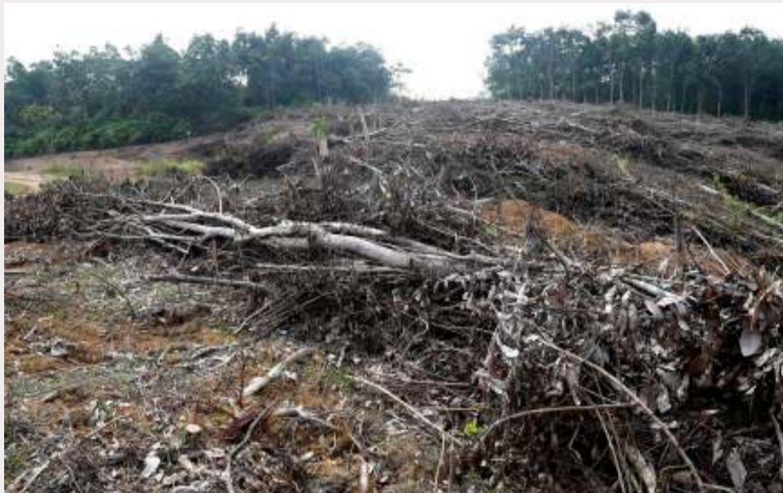
Bildet fra mai viser en skog som er fjernet for å gi plass til en plantasje for palmeolje på Sumatra.

Hvordan kan en så forklare utviklingen i Himalaya, der desentralisering isteden førte til mindre avskoging?