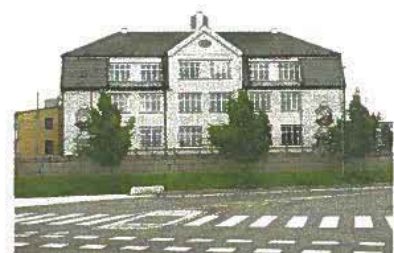
HJEMME | En del av oppveksten bodde Trygve Haavelmo på Sagdalen skole.

Sammen løftet de tre norsk sosialøkonomi opp i fagets internasjonale elitedivisjon.