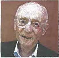
Kåre Willoch Statsminister 1981-1986

Hva betød Trygve Haavelmo for deg, og hva betød han i større perspektiv?