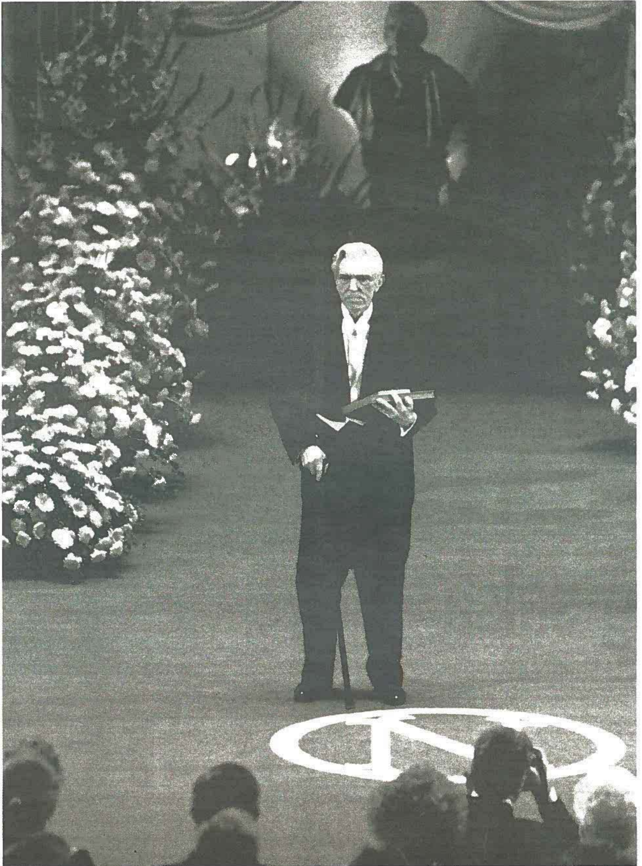
EN ENER | Trygve Magnus Haavelmo mottar Nobelprisen i økonomi i Stockholm i 1989.