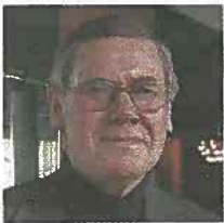
Gunnar Berge Finansminister 1986-89

skal uttale oss med skråsikkerhet. Nobelprisen er et uttrykk for at han bidro til å utvikle det økonomiske faget. Her hjemme spilte han en viktig rolle som lærer på universitetet og som rådgiver for regjeringen.