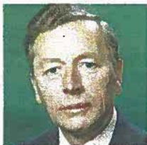
Ragnar Christiansen Finansminister 1971-72

studentene skrive referat fra forelesningene, som så, etter bearbeidelse gikk inn i pensum. Jeg hadde stor glede av en bok han skrev om investerings- og kapitalteori. Jeg fikk ham også som sensor til eksamen, og hadde jo fordel av at jeg hadde lest mye av ham. Han stilte gjerne økonomihistoriske spørsmål. Det gikk bra, men jeg husker at jeg bommet på ett av spørsmålene!