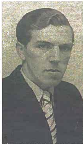
EMIGRANT | Trygve Haavelmo klar til USA-reisen som varte i sju år fra 1939.

Trygve Haavelmo bidro med sin beskjedenhet og sine bestrebelsler på å unngå fokus på egen person, til ikke så rent lite mytedannelse omkring seg selv. Denne strekker seg helt inn i Kungliga Vetenskapsakademins begrunnelse for å gi ham Nobelprisen – pressemeldingen fortalte at han hadde sin doktorgrad fra Har-