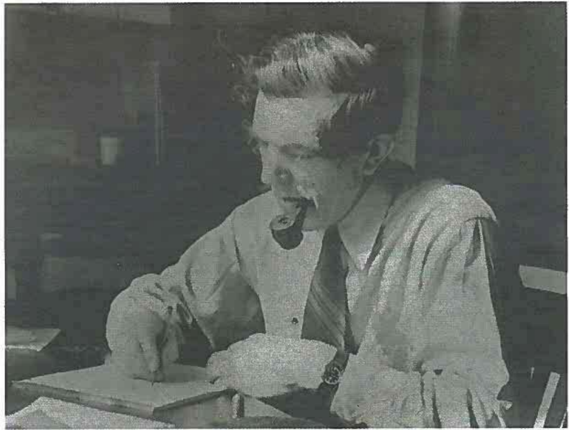
SNART HUEM | Trygve Haavelmo på kontoret i Chicago i 1947

forskningsprosjekter, var han også meget interessert i utformingen av den daglige, økonomiske politikken. Jeg husker blant annet en innledning han holdt om nullvekst, det var jo ikke Arbeiderpartiets linje, vårt motto var «Vekst og vern», men Haavelmo hadde en interessant redegjørelse om både de positive og negative konsekvenser av en nullvekstlinje.